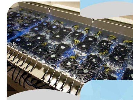
تولید کننده روغن مایر