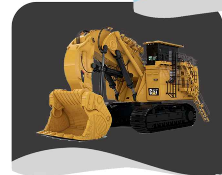
تولید کننده روغن هیدرولیک