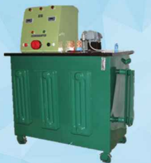
تولید کننده روغن ترانسفورماتور رکتیفایر