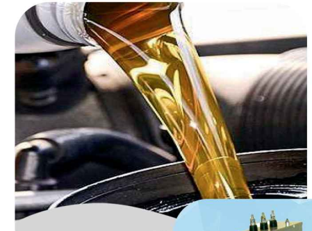
تولید کننده روغن موتور

زنگان: کیلومتر ۵ جاده دندی، شهرک صنعتی نوآوران، خیابان نوآوران ۶ ۰۲۴-۳۲۳۸۵۲۹۷ ☎ ۰۲۴-۳۲۳۸۵۰۹۷ 📠 www.petroa.ir petroariacompany@gmail.com