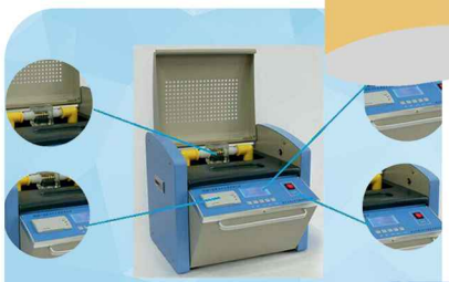
تست روغن ترانسفورماتور