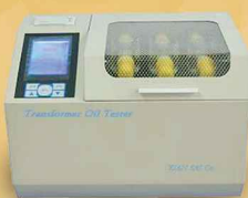
دستگاه تست روغن ترانسفورماتور