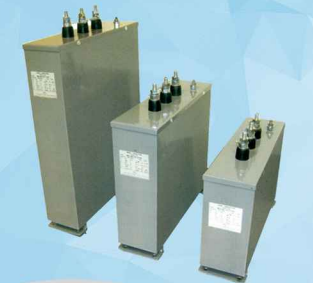
تولید کننده روغن خازن